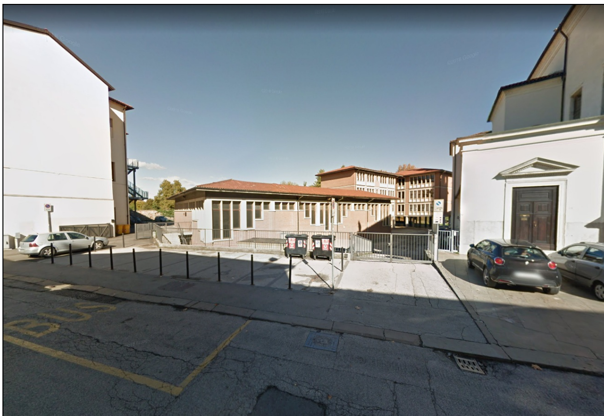
Foto 1.1. Estratto google map vista scuola "Maffei" da c.trà Santa Caterina.

L'intervento in oggetto, a completamento della fase progettuale, ai sensi dell'art. 23 del D.Lgs. n. 50/16, implementato e coordinato, successivamente, dal D.Lgs. n. 56/17, si pone l'obiettivo di riqualificare energeticamente parte dell'edificio scolastico, sito al civ. 11, di c.trà Santa Caterina, insistente nel centro storico della città di Vicenza, ed inserito nell'Istituto Comprensivo Vicenza 1, con sede in contrà Burci, 20.