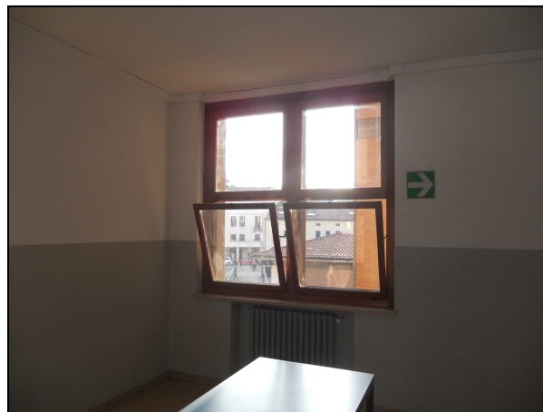
Foto 1.2. Alcuni serramenti esistenti presso l'istituto scolastico "F. Maffei", oggetto di sostituzione.

Nel dettaglio, i lavori prevedono la completa sostituzione degli elementi esistenti con l'impiego di nuovi profilati in lega di alluminio, costituiti da ante fisse, con pannellature opache coibentate, ed ante apribili ad anta e anta e ribalta, secondo il principio delle 3 camere, costituiti cioè da profili interni ed esterni tubolari e dalla zona di isolamento, per garantire una buona resistenza meccanica e giunzioni a 45° e 90° stabili e ben allineate.